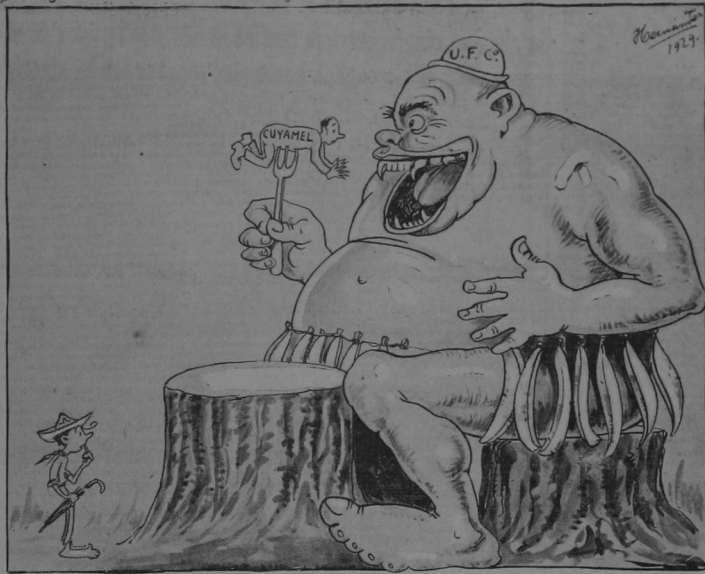
¡Y PENSAR QUE YO ME ATENIA A ESE PARA QUE ME DEFENDIERA!!

"Circula la noticia, no confirmada OFICIALMENTE, de que la U. F. Co. compró las acciones de la Cuyamel".